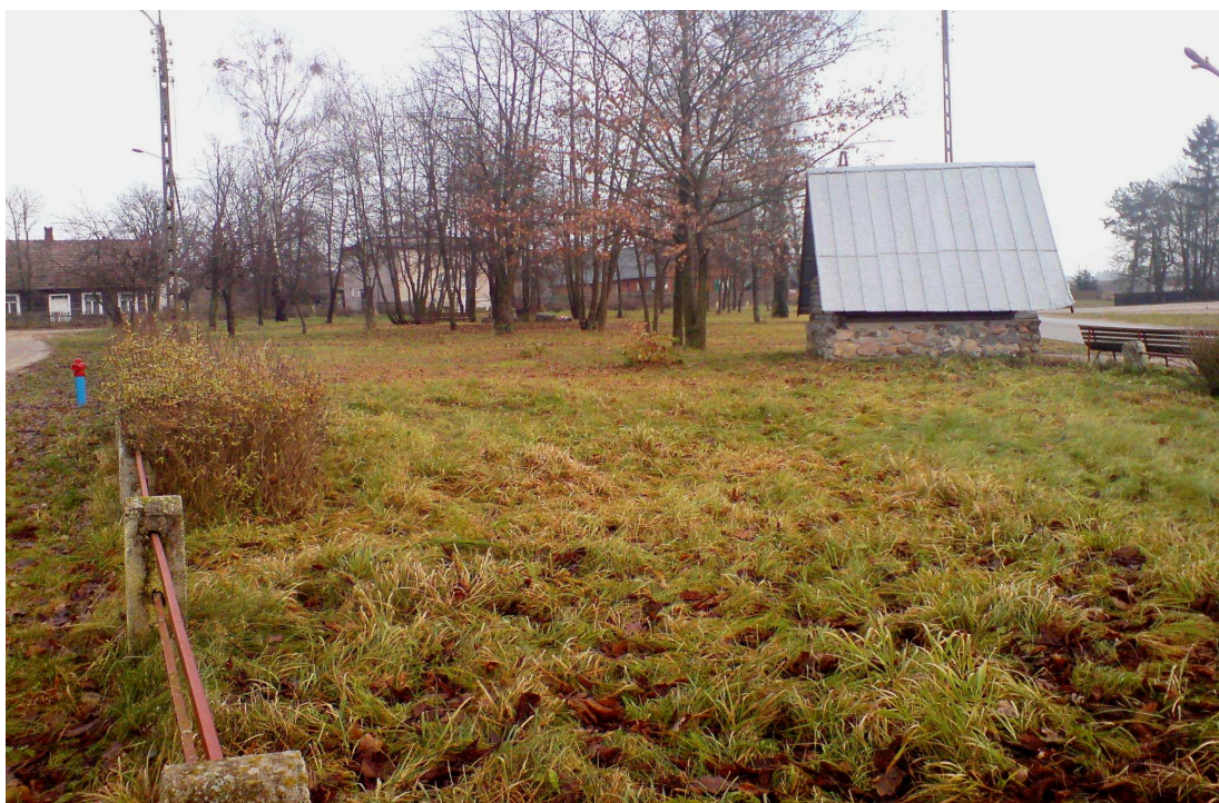
Park wiejski w Jaminach