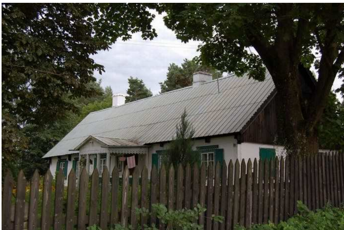
Budynek zabytkowej plebanii

drewnianej miejscowości Jaminy i stanowi zespół zagrodowy nr 16, wpisany do rejestru zabytków. Zagroda ta składa się z budynku byłej plebanii z pocz. XIX w. (obecnie budynek mieszkalny) oraz ze stodoły z poł. XIX w.