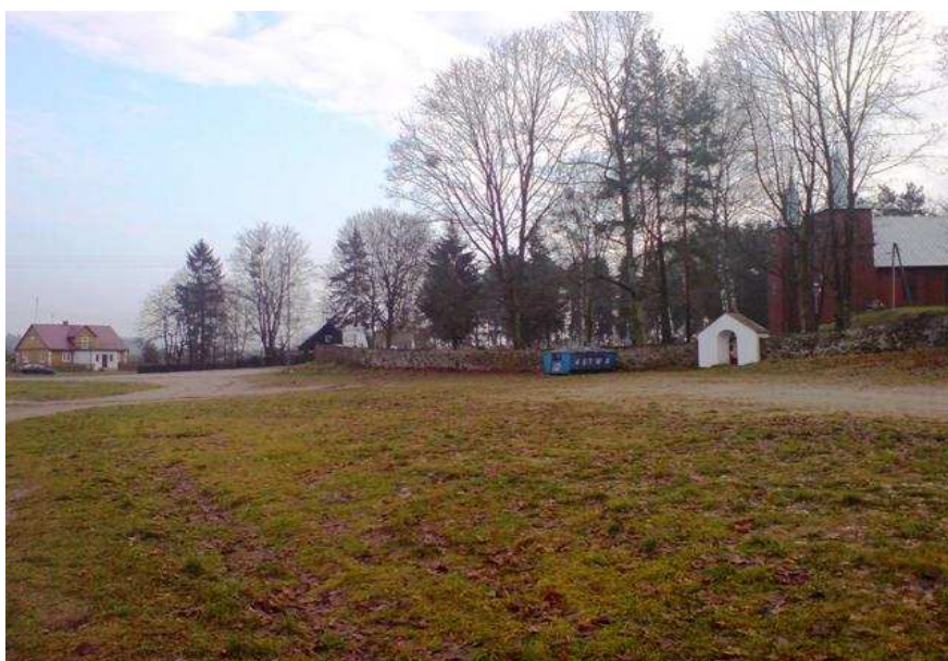
Obecny wygląd parkingu przed kościołem parafialnym.

Na terenie będącym przedmiotem opracowania nie znajdują się żadne nawierzchnie utwardzone, występuje natomiast piwnica ziemna. Teren obejmujący inwestycję jest płaski a różnica maksymalna terenu wynosi 1,80m. Znajduje się infrastruktura techniczna nadziemna z postaci linii niskiego napięcia oraz podziemna w postaci wodociągu oraz linii telekomunikacyjnej