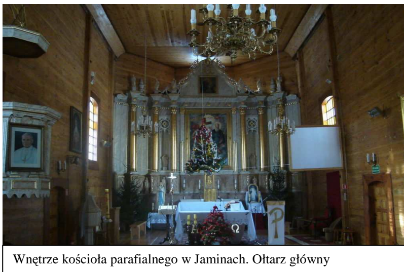
Wnętrze kościoła parafialnego w Jaminach. Ołtarz główny

Czy ołtarz główny pochodzi z Augustowskiego kościoła, trudno jest w sposób jednoznaczny określić. Wiadomo, że 1853 r. ołtarz ten istniał. Ołtarz boczny z obrazem Matki Bożej istniał już w 1853 r. i można przypuszczać, że został przeniesiony wraz z kościołem. Ołtarz św. Mateusza Apostoła był wtedy jeszcze prowizoryczny, gdyż był w budowie. Jednak w roku 1869 już istniał w całości wraz z obrazem patrona parafii św. Mateusza Apostoła.